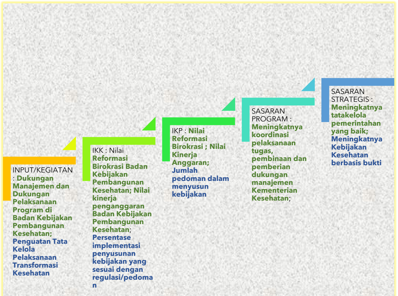
Gambar II.1 Kerangka Logis IKP dan IKK Sekretariat BPKP