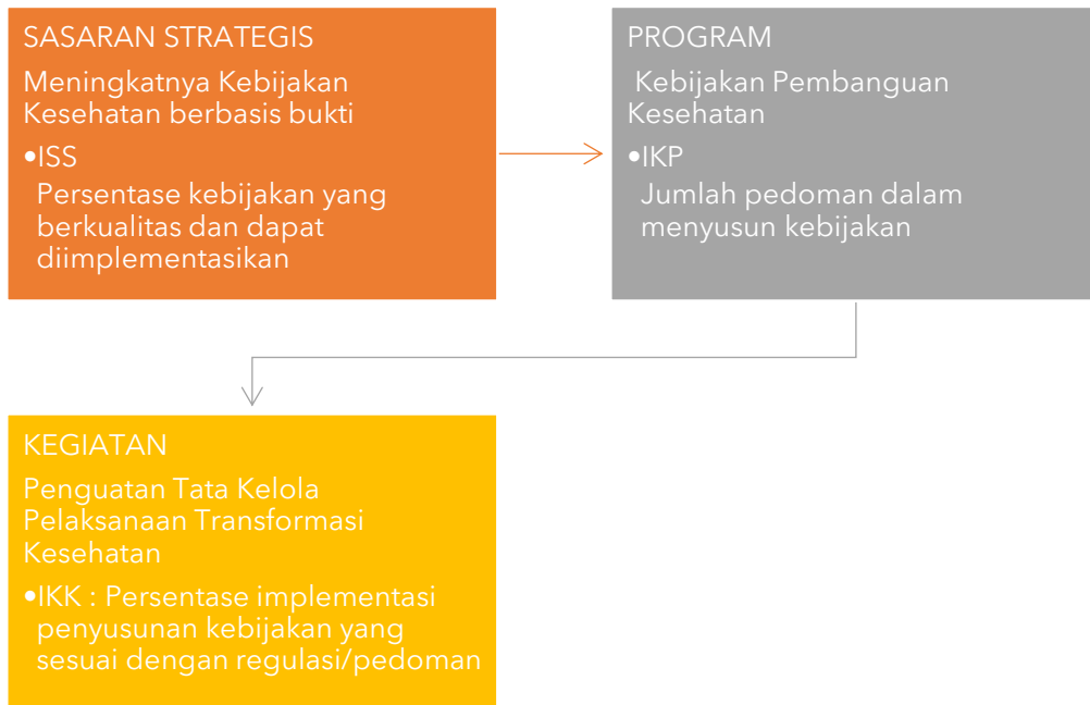
Gambar II. 3 Cascading Sasaran Strategis (SS), Indikator Kinerja Program (IKP) dan Indikator Kinerja Kegiatan (IKK) Sekretariat BKPK pada Program Kebijakan Pembangunan Kesehatan